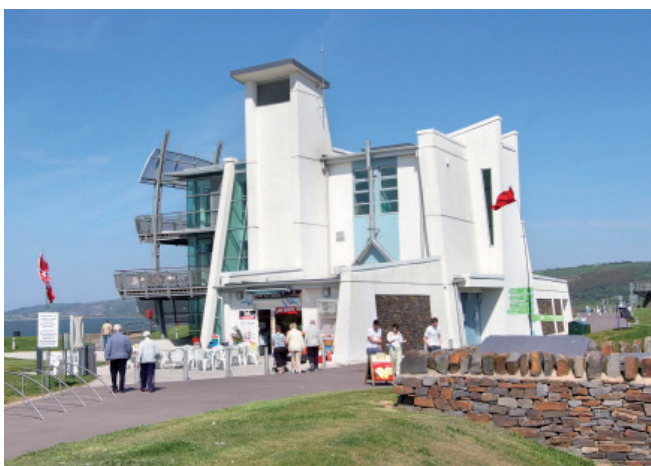
Canolfan Gwlyptiroedd Genedlaethol Cymru / National Wetlands Centre Wales

Gallwch weld mapiau o'r llwybrau ar www.mbwales.com